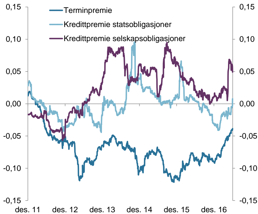
Figur 2. Obligasjonsinvesteringenes faktoreksponeringer. Koeffisienter

Analysen av fondets renteinvesteringer viser at fondet er mindre eksponert mot obligasjoner med lang løpetid enn referanseindeksen. Renteinvesteringenes eksponering mot kredittpremie til selskapsobligasjoner relativt til referanseindeksen var økende i kvartalet. Denne modellen hadde en forklaringsgrad på rundt 10 prosent ved utgangen av kvartalet som var en nedgang fra rundt 20 prosent ved inngangen til kvartalet.